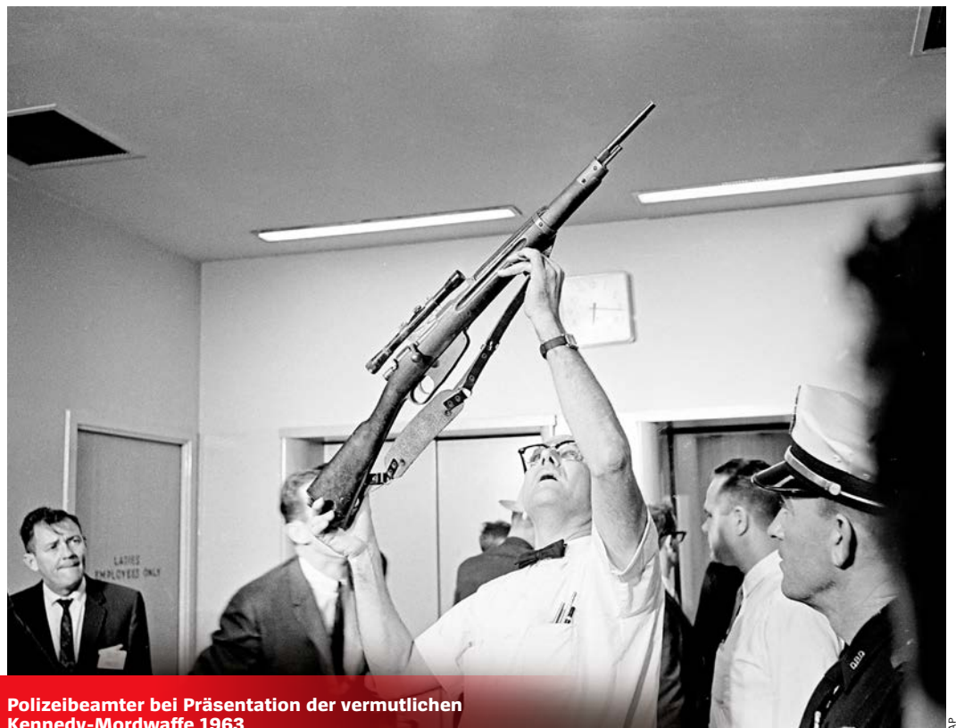
Polizeibeamter bei Präsentation der vermutlichen Kennedy-Mordwaffe 1963

Schneider: Der Stil der amerikanischen Politik ist grundsätzlich para-